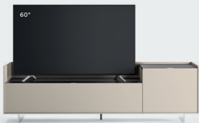
Cabaret 64D dx L / W 2120 x H 635 x P / D 570 – Step H 160 Grigio Corda • Top Nero Greco • piedi metacrilato / methacrylate feet H 120

Una panoramica di basi Cabaret in diverse finiture, configurazioni e dimensioni dove il gioco dei volumi in altezza è realizzato con un piano ribassato di 160 mm che determina spazi espositivi diversi: per appoggiare semplicemente la TV o per creare un vassoio su cui riporre vari oggetti.