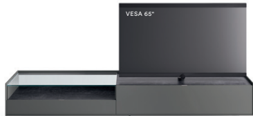
Cabaret 4B dx L / W 2720 x H 475 x P / D 570 – Teca H 160 Ferro • Top Nero Greco • piedi metacrilato / methacrylate feet H 120