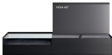
Cabaret 10B dx L / W 2720 x H 555 x P / D 570 – Teca H 160 Rovere Carbone • Top Nero Greco • piedi metacrilato / methacrylate feet H 120

La TV può essere collocata in appoggio sulla base, oppure alcune combinazioni prevedono la possibilità di inserire il supporto TV orientabile Vesa. Per ogni composizione viene riportata la dimensione di schermo consigliata e la dimensione massima utilizzabile.