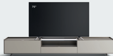
Cabaret 4C L / W 2720 x H 435 x P / D 570 – Teca H 160 Grigio Corda • Piombo • piedi / feet Piombo