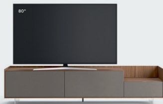
Cabaret 9D sx L / W 2420 x H 555 x P / D 570 – Step H 160 Noce • Piombo • piedi metacrilato / methacrylate feet H 120

An overview of Cabaret bases in various finishes, configurations and sizes, with a play of volumes in height achieved with a lowered 160 mm top, determining different display spaces: simply to hold the TV or to create a tray on which to place assorted objects.