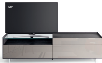
Cabaret 15B dx L / W 2420 x H 635 x P / D 570 – Teca H 160 Rovere Carbone • Grigio Corda Lucido • piedi metacrilato / methacrylate feet H 120

The TV can sit freely on the base, or in some combinations, the Vesa swivel TV stand can be attached. For each composition, the recommended and maximum screen sizes are specified.