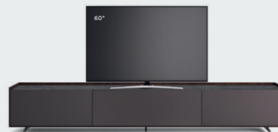
Cabaret 12A L / W 3020 x H 515 x P / D 570 Brown • Top Pietra Savoia • piedi / feet Brown

Fra le varie personalizzazioni, c'è la possibilità di attrezzare l'anta a ribalta anteriore con un frontale microforato che permette di gestire l'impianto all'interno con il telecomando, nascondendolo alla vista.