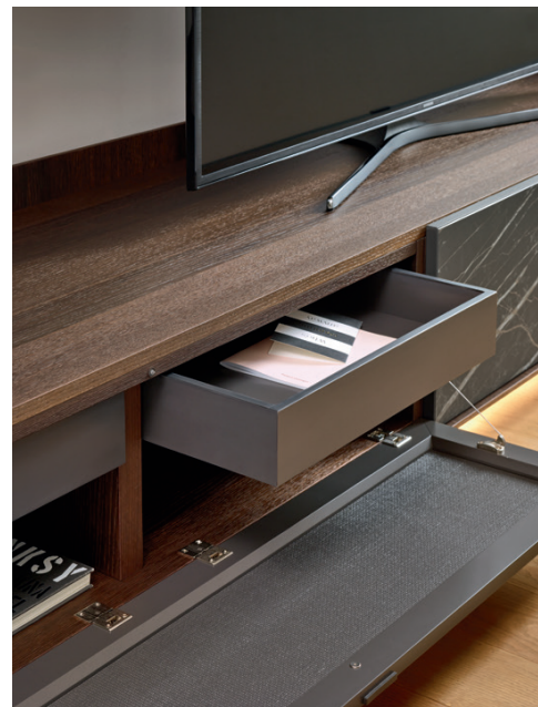
Base Cabaret Ceramica 3E L / W 2420 x H 515 x P / D 570

I frontali in Ceramica con effetto Noir Desir, in abbinamento alla finitura Rovere termotrattato, rendono particolarmente suggestivo questo elemento d'arredo, conferendogli un particolare carattere estetico. Come si vede nell'immagine, alcune basi con ribalta possono essere dotate, su richiesta, di cassetti interni.