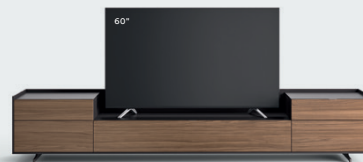
Cabaret 26D L / W 2720 x H 515 x P / D 570 – Step H 160 Noce • Brown • piedi / feet Brown